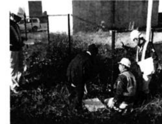
【境界プレート設置】