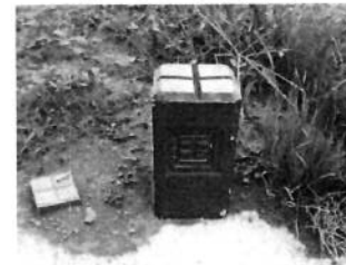
【コンクリート杭設置】