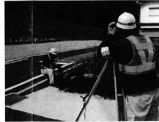
【コンクリート杭設置】