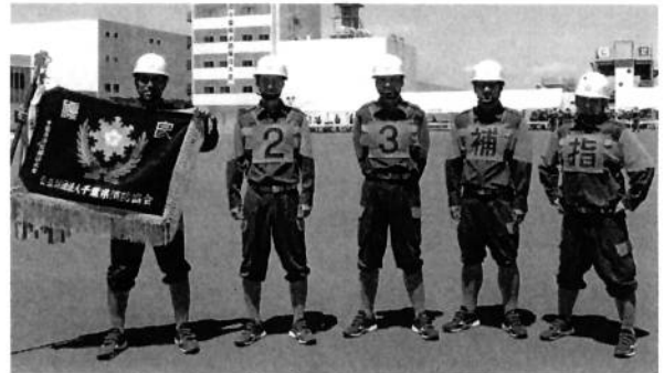
小型ポンプ操法の部の皆さん