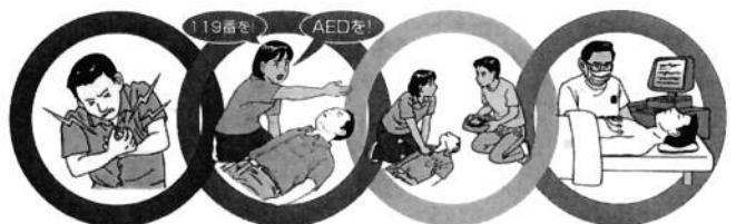
心停止の予防 心停止の早期認識と通報 早い心肺蘇生とAED 救急隊や病院での処置