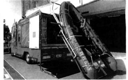
↑車両上部には、救助艇を積載しています。

夏休みかがお過ごしでしょうか? 海や川へレジャーに行く方も多いと思います。でも自然は危険がたくさんあります。 昨年、市内では25件の水難事故が発生しています。毎年、夏のシーズンになると全国各地で、痛ましい事故が起きています。 皆さん、危険な場所には近づかないようにしましょう。でも、万が一、水難事故に遭ったら、どうしますか?