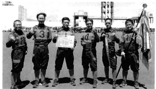
ポンプ車操法の部の皆さん