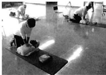
救命講習会の様子

●各講習の受付開始 8月22日(月) 9:00から 定員12名 電話で受付 047-333-2111(音声ガイダンス2番) ※新型コロナウイルス状況により中止となる場合があります