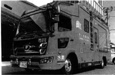
↑昨年度、水難救助車を更新しました。

夏休みかがお過ごしでしょうか? 海や川へレジャーに行く方も多いと思います。でも自然は危険がたくさんあります。 昨年、市内では25件の水難事故が発生しています。毎年、夏のシーズンになると全国各地で、痛ましい事故が起きています。 皆さん、危険な場所には近づかないようにしましょう。でも、万が一、水難事故に遭ったら、どうしますか?