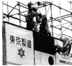
空気呼吸器を着装し降下

市民の安全・安心を守る消防救助隊員が、救助技術の高度化に必要な基礎的要素を練磨することを通じて、消防活動に不可欠な体力、精神力、技術力を養うことを目的として開催されます。全国の隊員が一堂に会し、救助技術を競い、学ぶことを通じて、他の模範となる隊員を育成し全国民の消防に寄せる期待に力強く応える大会となっております。