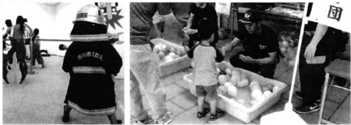
体験コーナーのほかにも消防士になりきっての写真やチーパくんも写真が撮れるよ