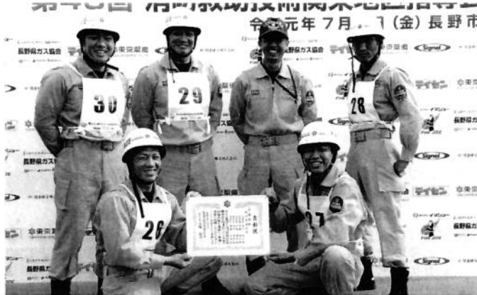
全国大会出場メンバーと救助隊長

令和元年8月25日(日)に岡山県岡山市で開催される、第48回全国消防救助技術大会に東消防署の引揚救助チームが出場します。この大会は、千葉県大会、関東大会を勝ち抜いた上位チームが出場できる救助隊の全国大会です。