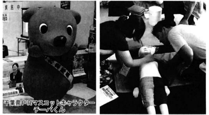
「1日救急隊長」としてチーパくんも参加します 乳児や小児に対するAEDを使用した心肺蘇生法も体験できます

【開催日時】 令和元年9月7日（土） 13時～15時30分 【開催場所】 ニッケコルトンプラザ（鬼高1丁目1番1号） 「コルトンホール」及び「タワーコート」 【問い合わせ】 消防局 救急課 TEL 047-333-2111（音声ガイダンス②番）