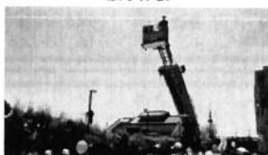
はしご車試乗体験