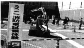
ミニ消防車試乗体験