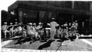
消防音楽隊の演奏

はしご車試乗体験、ミニ消防車試乗体験、放水体験、救助体験、AED取扱訓練、消防音楽隊の演奏、地震体験など