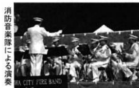
消防音楽隊による演奏