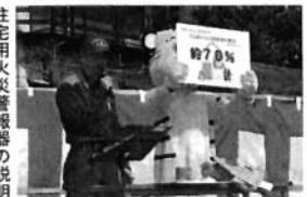
住宅用火災警報器の説明