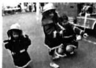
おやこ消防士体験