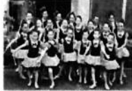
ユニバーサルパトン