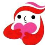
犯罪被害者等支援シンボルマーク「ギョuttoちゃん」