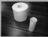
トイレットペーパーの芯