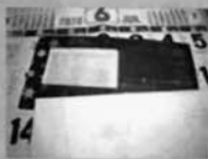
封筒、加納ター ・ビニール部分、金属部分は分けて排出