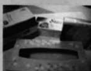
ティッシュの箱やお菓子の空き箱 ・ビニール部分は分けて排出